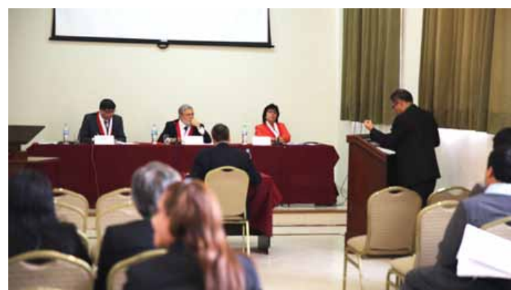
Audiencia Pública de Sala Segunda.

se constituyen en capitales de macro región de dos distintos distritos constitucionales; y añadió que “en el sur del país se seguirán atendiendo causas de Puno, Cusco, Moquegua, Tacna y la propia Arequipa, en tanto que la ciudad de Lima comprende aún la macro región Centro-Oriente”.