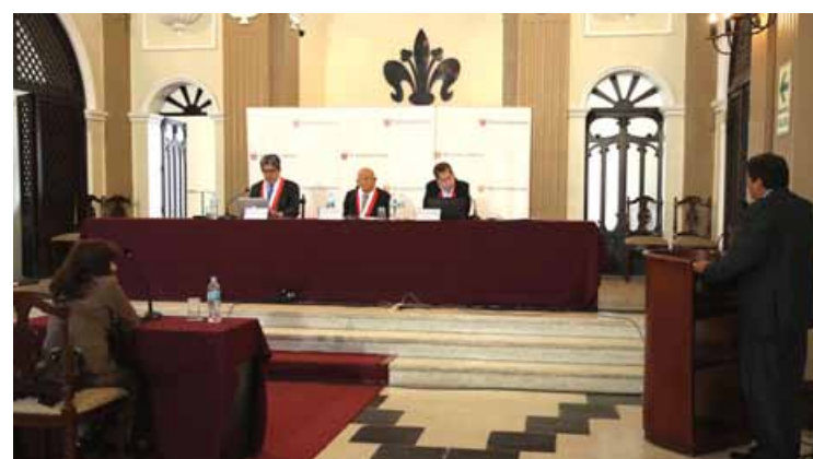
Audiencia Pública de Sala Primera.