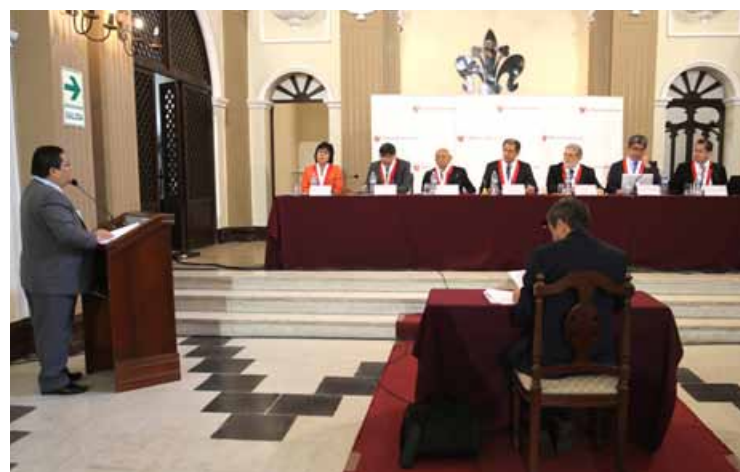
Audiencia Pública de Pleno.

Por su parte, el titular del TC, doctor Óscar Urviola Hani, dijo que “con la realización de esta primera audiencia pública en Trujillo, el renovado Pleno del TC da inicio a sus sesiones descentralizadas en el distrito constitucional de la Macro Región Norte, en estricto cumplimiento a lo