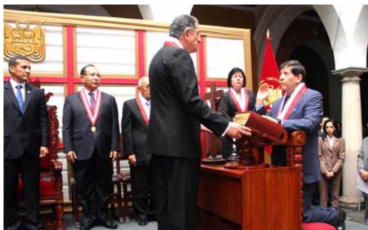
Magistrado Carlos Ramos Núñez juramenta como director general del Centro de Estudios Constitucionales del TC.

Banco de la Nación, de alrededor de 16,500 metros cuadrados, donde funcionará la sede del TC en Lima, desde fines del año 2016 aproximadamente.